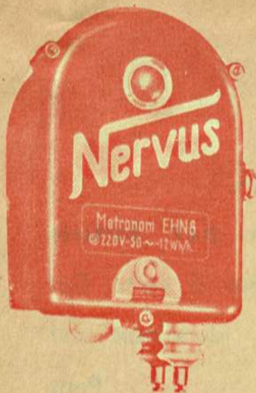
Coffret en bakélite d'une étanchéité parfaite